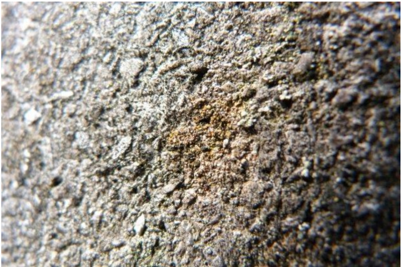
ze luisteren naar de mooie naam van muurzonnetje