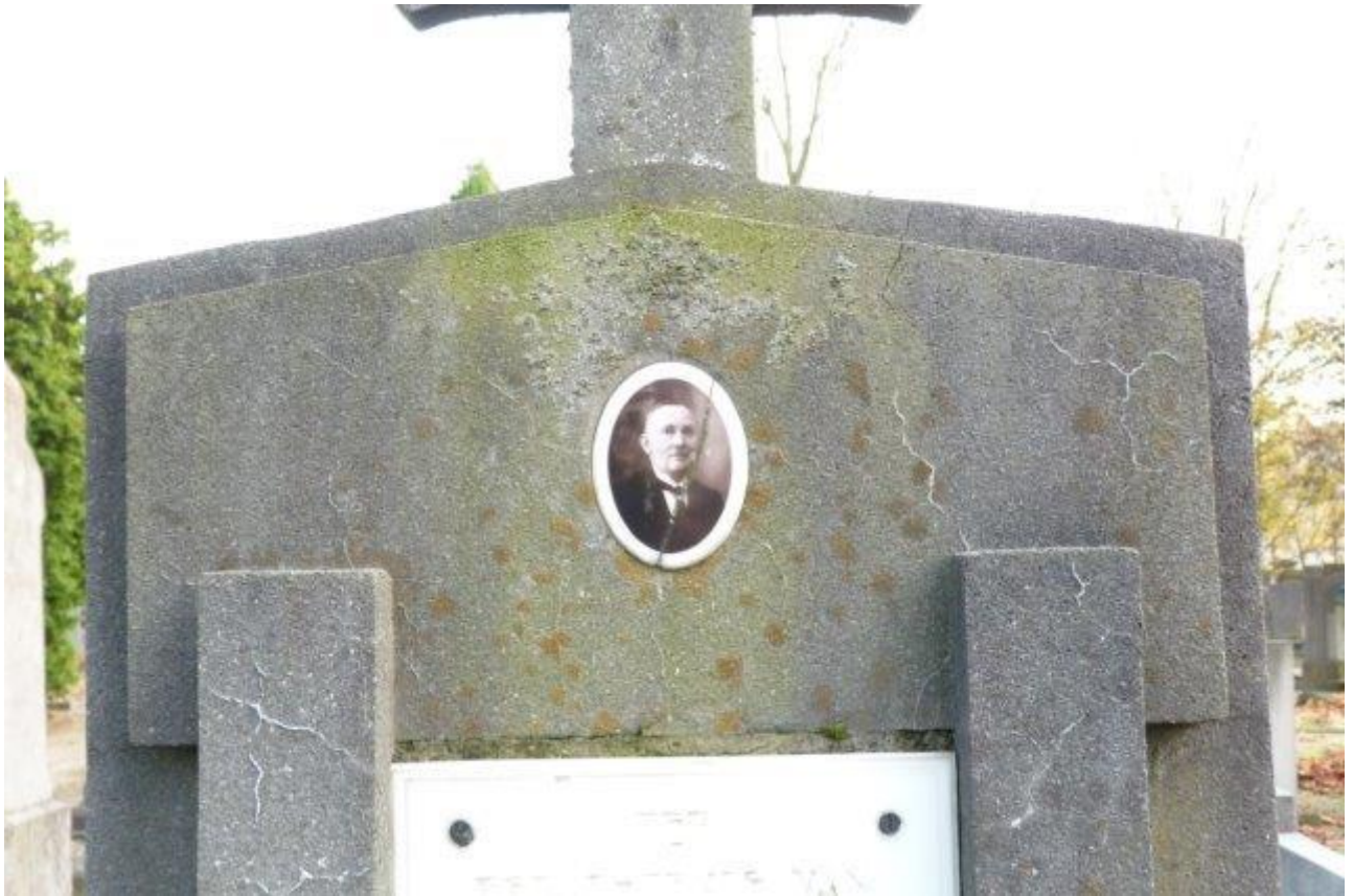
Zie je die oranjebruine vlekjes